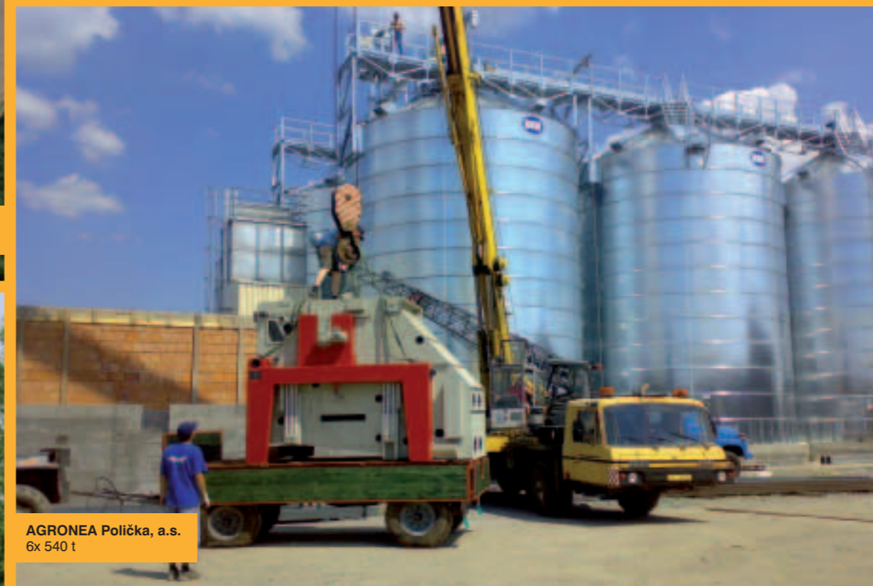
AGRONEA Polička, a.s. 6x 540 t