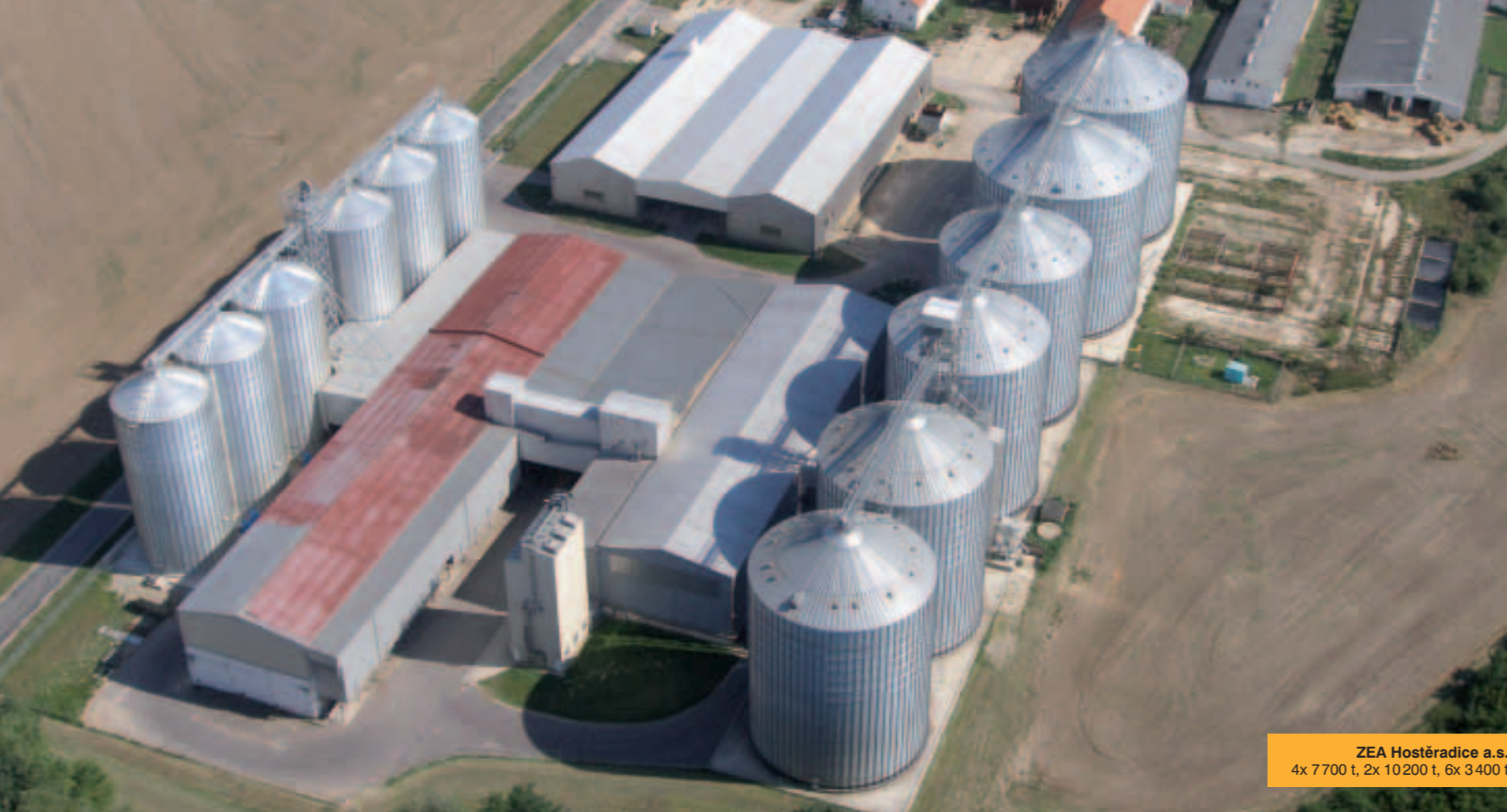
ZEA Hostěradice a.s. 4x 7700 t, 2x 10200 t, 6x 3400 t