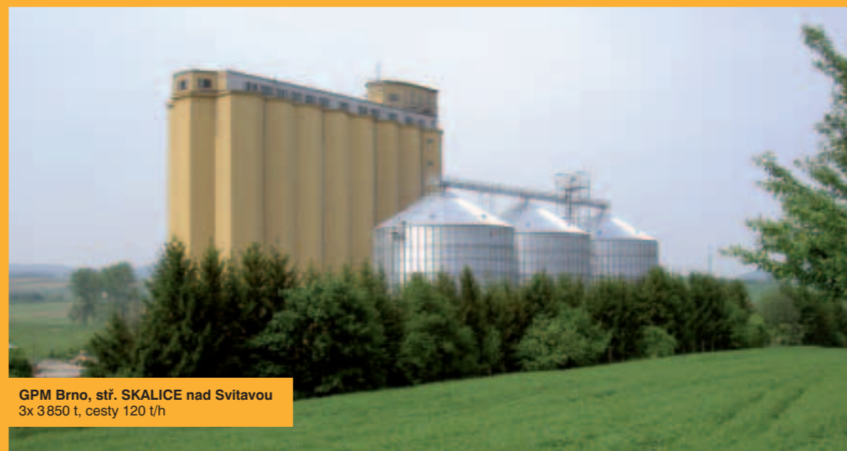
GPM Brno, stř. SKALICE nad Svitavou 3x 3850 t, cesty 120 t/h