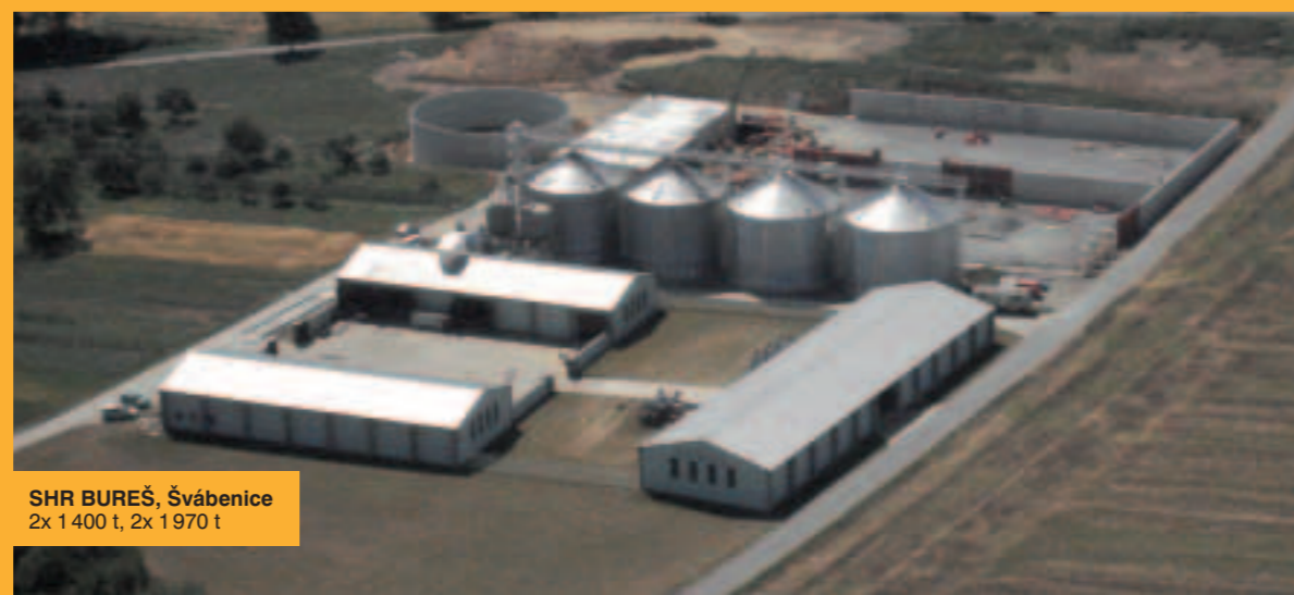
SHR BUREŠ, Švábenice 2x 1400 t, 2x 1970 t