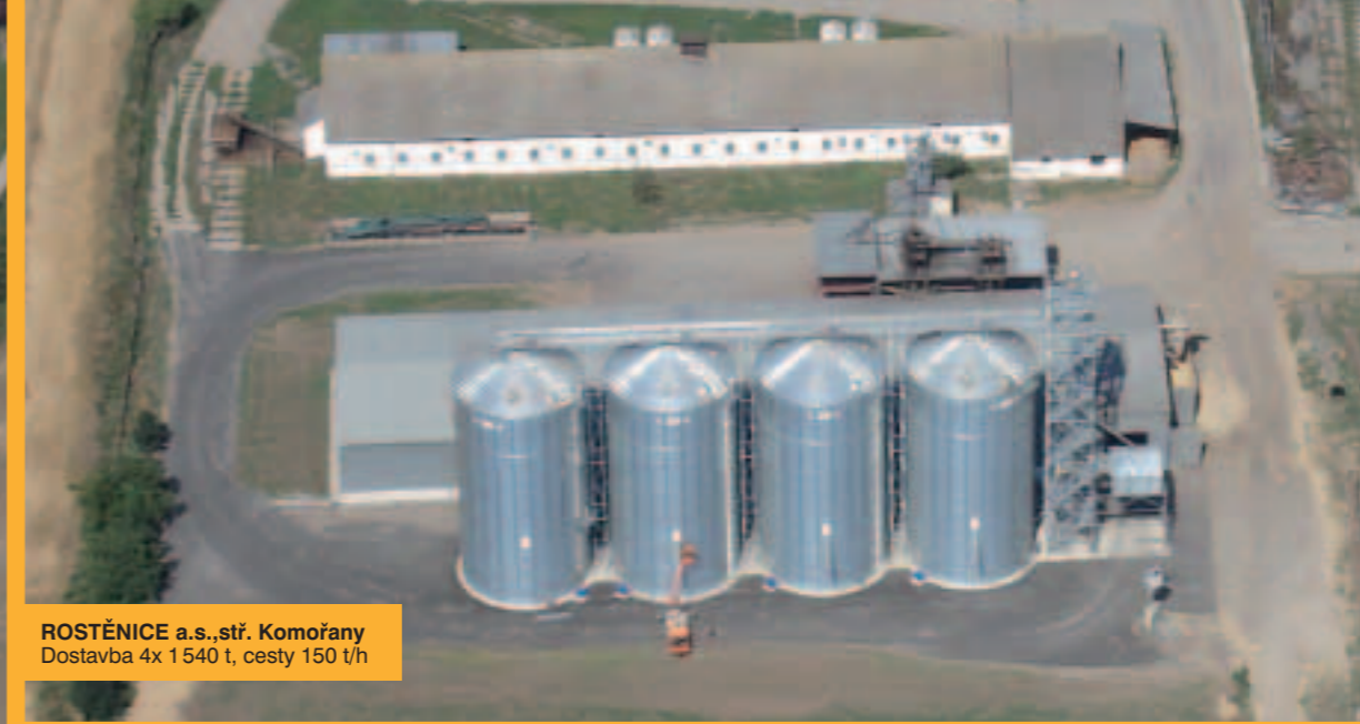
ROSTĚNICE a.s.,stř. Komořany Dostavba 4x 1540 t, cesty 150 t/h