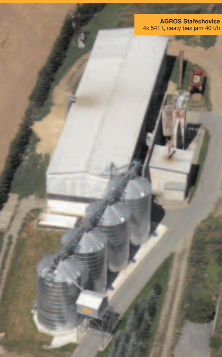
AGROS Stařechovice 4x 541 t, cesty bez jam 40 t/h